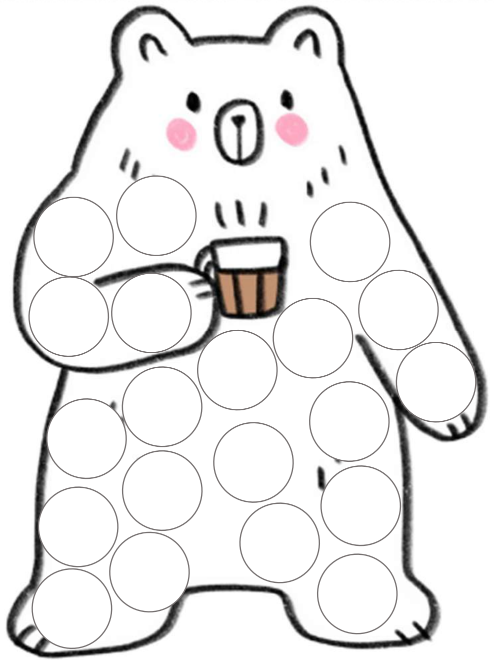
BEAR / bear