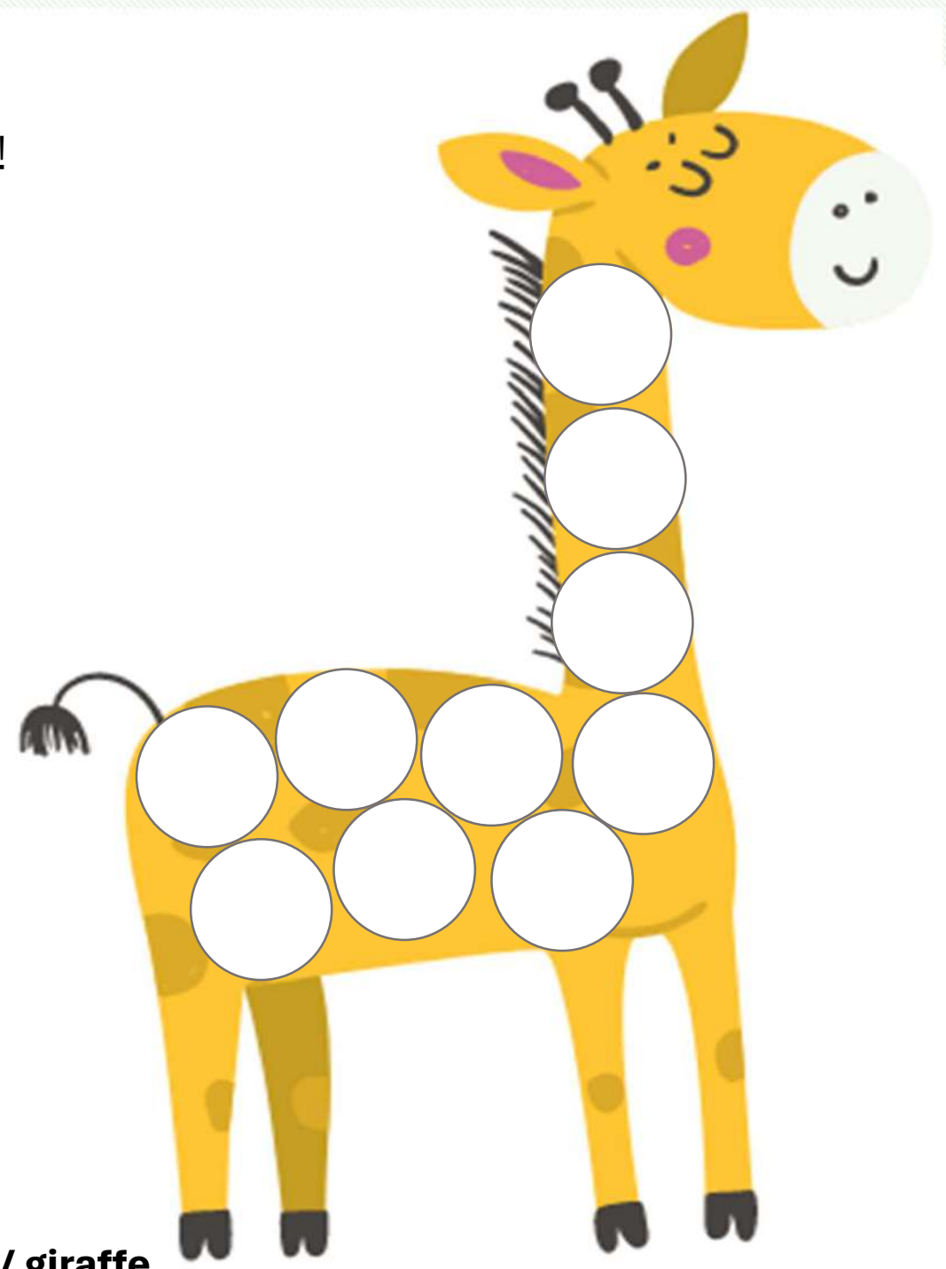
GIRAFFE / giraffe